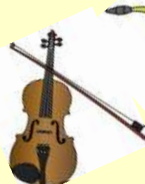
バイオリン技術者