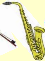
管楽器リペアマン