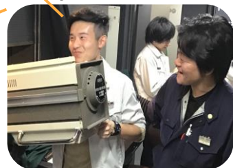
機材のノウハウやビジネススキルも学ぶ