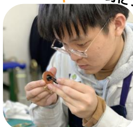
修理箇所を見極める力が身につく