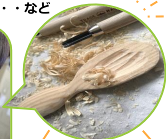
工具を使いこなす！